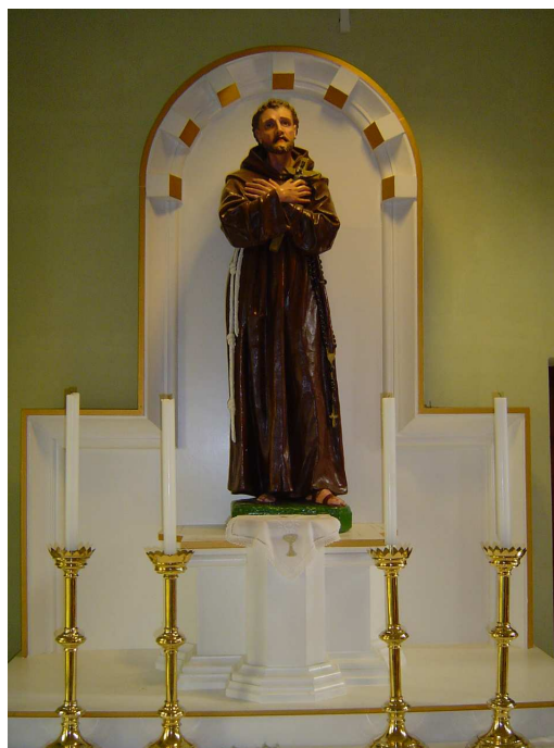
Templomunk Szent Ferenc oltára