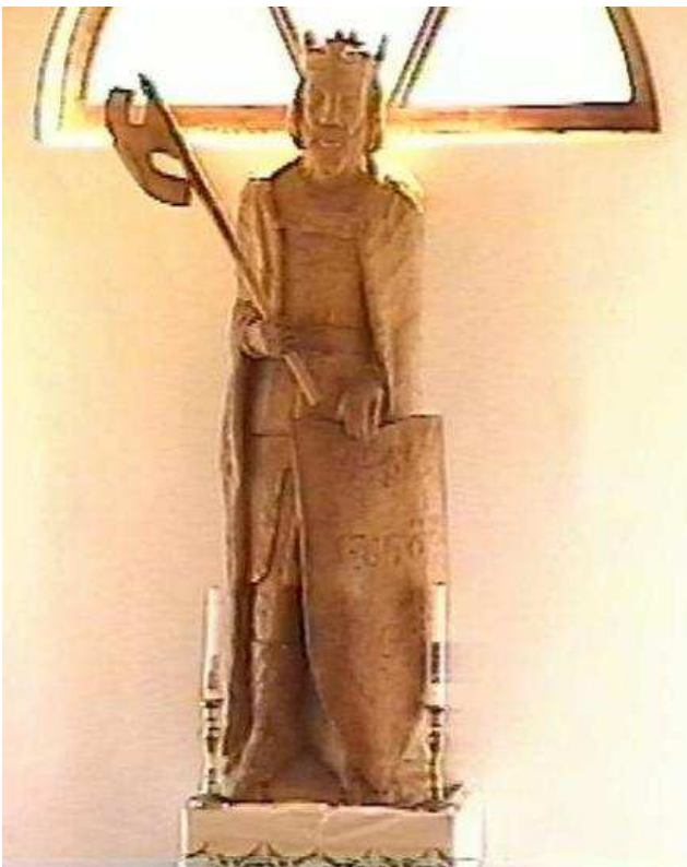
A bokrosi Szent László templom főoltár szobra

I. Béla és Rikéra, lengyel király leánya, fia. 1040. körül született Lengyelországban. Mint vezér már Salamon király idejében feltűnt vitézségével; mint király pedig kitűnt nagy vallásosságával, igazságszeretettel és politikai bölcsességével. Mint gondos uralkodó eltiltotta a pogányságot, - és bölcs törvényeivel megerősítette a kereszténységet. S hogy ezt emelje, mint fentebb láttuk, VII. Gergely pápánál keresztül vitte Szent István és Szent Imre szentté avatását. S így Szent István az első keresztény király, akit szentté avattak, s Szent Imre az első keresztény herceg, aki az oltárra került. Jámorságának, vitézségének híre elterjedt a külföldre is, csodáinak sokasága pe-