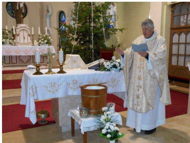
Szent József templom, 2016. január 10.

Kérjük, hogy személyi jövedelemadója 1 % -ának felajánlásával támogassa a Csongrádi Ferences Hagyományokért Egyesület tevékenységét.